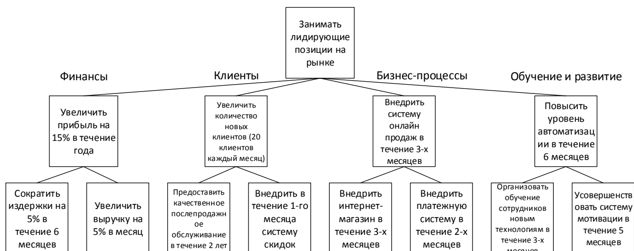
Пример дерева целей организации